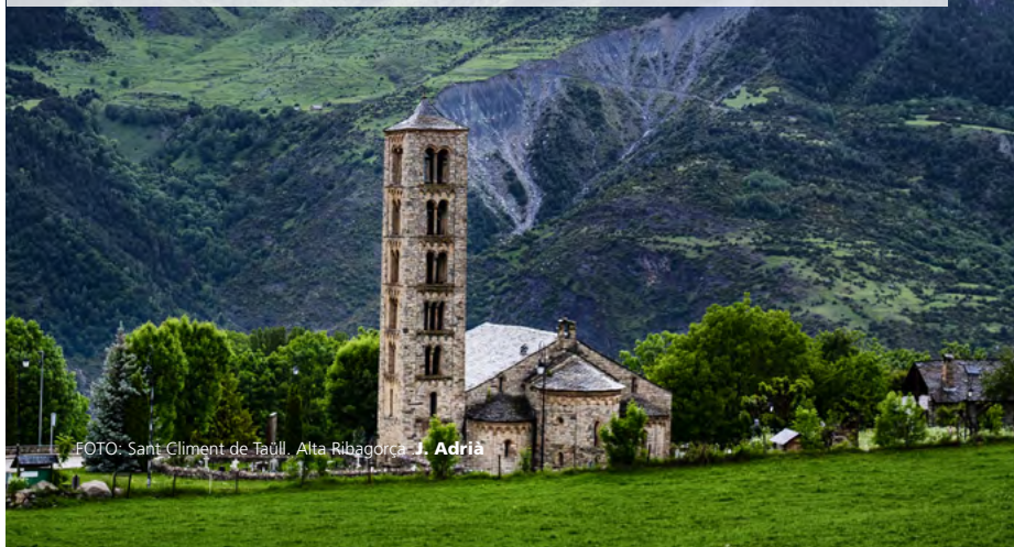
Sant Climent de Taüll, Alta Ribagorça

Patronat Comarcal de Turisme de l'Alta Ribagorça - www.turismealtaribagorca.cat Patronat de la Vall de Boí - www.vallboi.com