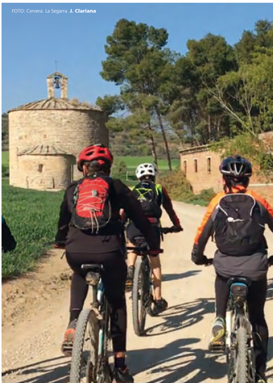
FOTO: Cervera. La Segarra.