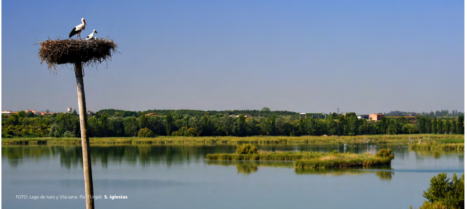
FOTO: Lago de Ivars y Vila-sana. Pla d'Urgell.