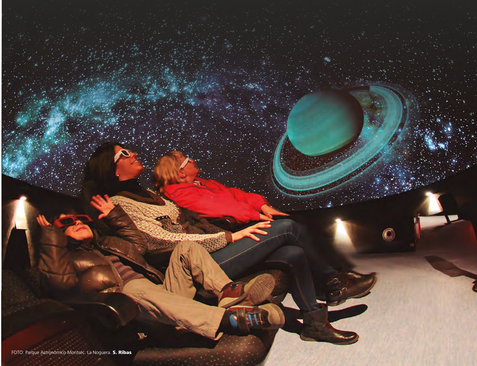
FOTO: Parque Astronómico Montsec. La Noguera.

La Vall de Boí, en la Alta Ribagorça, y Les Valls de Àneu, en el Pallars Sobirà, fueron los primeros territorios de Lleida en obtener una certificación de Turismo Familiar. Lo da la Agencia Catalana de Turismo a municipios especialmente sensibles con este segmento de público, adultos con niños, para el cual adaptan equipamientos y servicios.