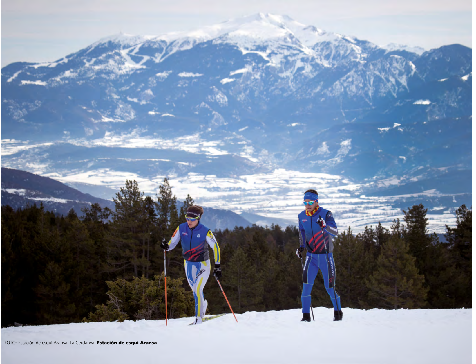
FOTO: Estación de esquí Aransa. La Cerdanya. Estación de esquí Aransa