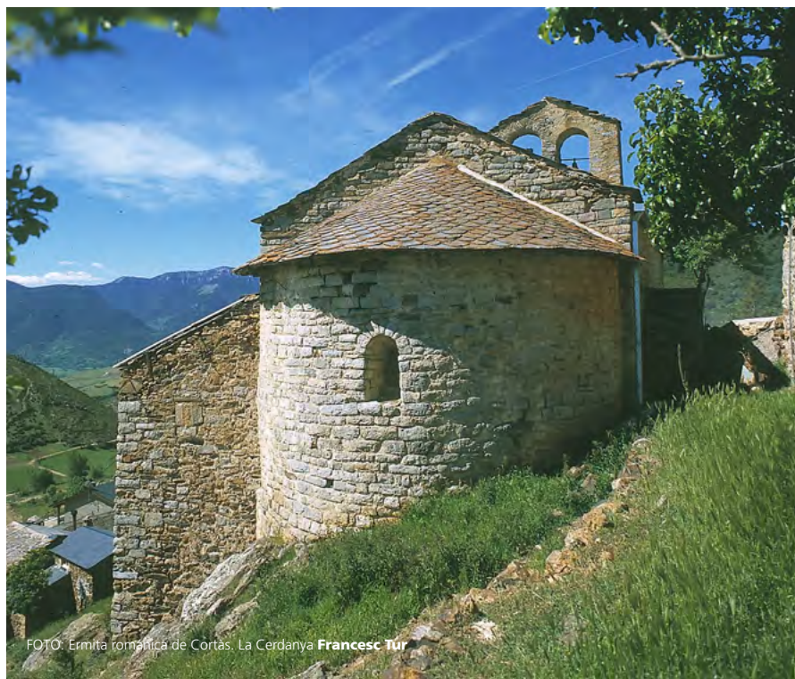
Ermita romànica de Cortàs. La Cerdanya