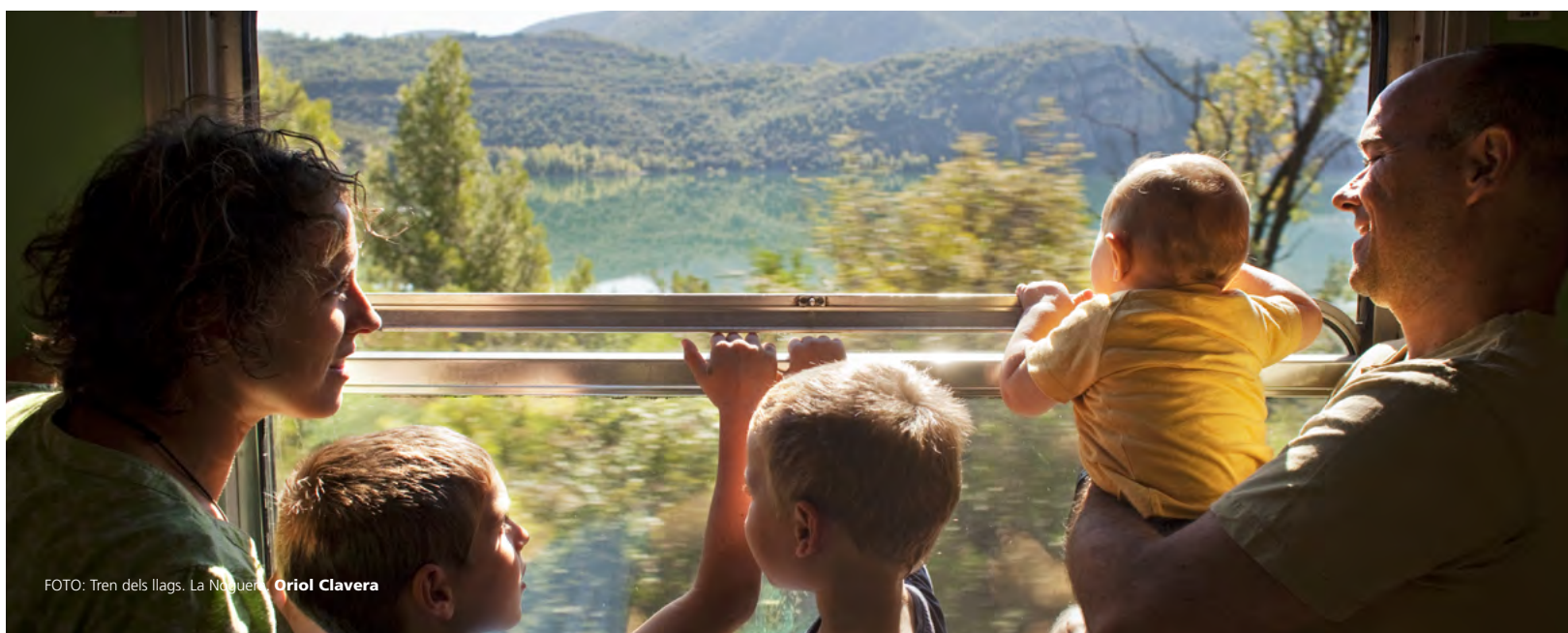
Tren dels llacs. La Noguera.