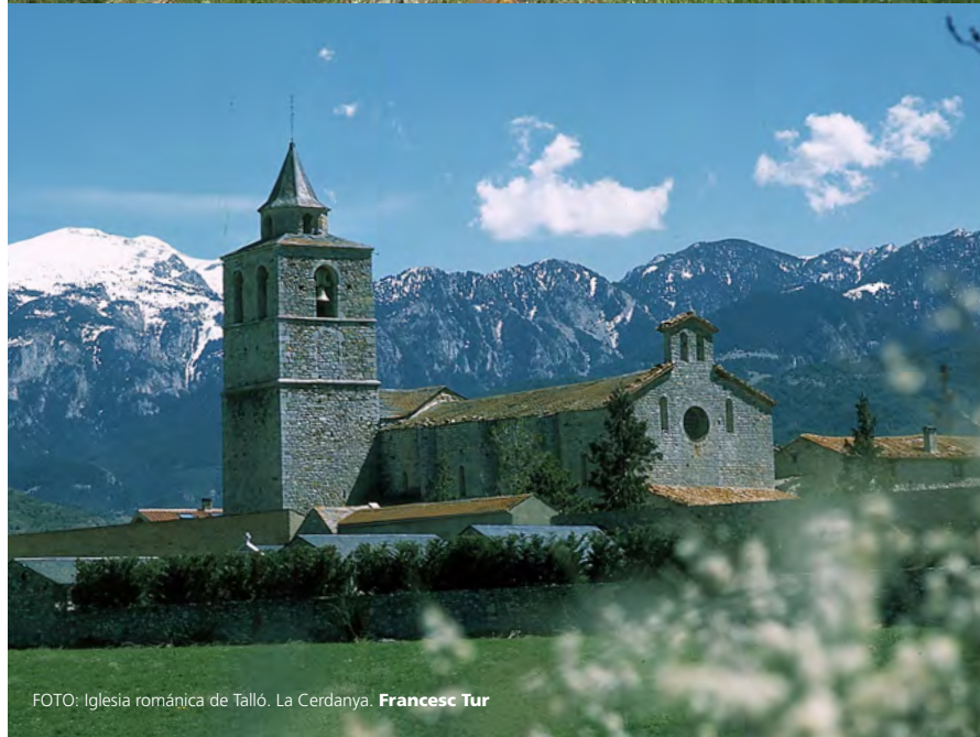
Iglesia romànica de Talló. La Cerdanya