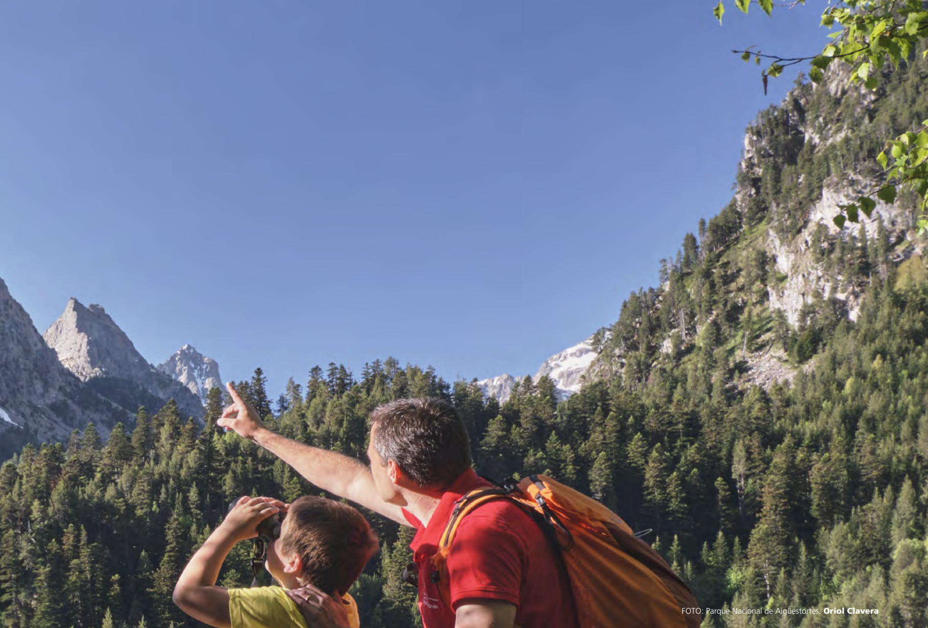
Parque Nacional de Aigüestortes.