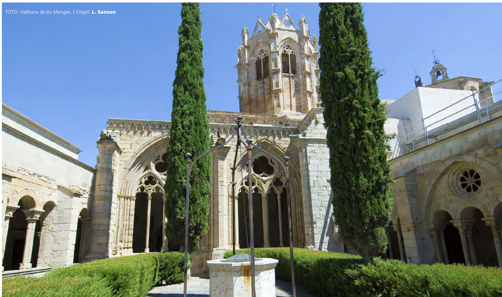
FOTO: Vallbona de les Monges. L'Urgell.

www.monestirvallbona.cat/historia-del-monestir/