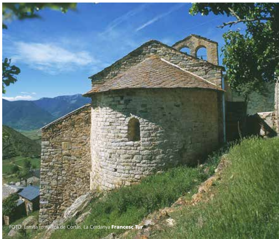
FOTO: Ermita romànica de Cortàs. La Cerdanya