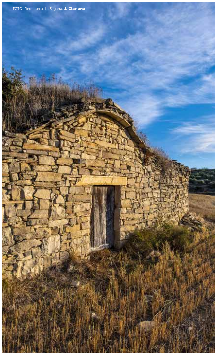
Piedra seca. La Segarra.