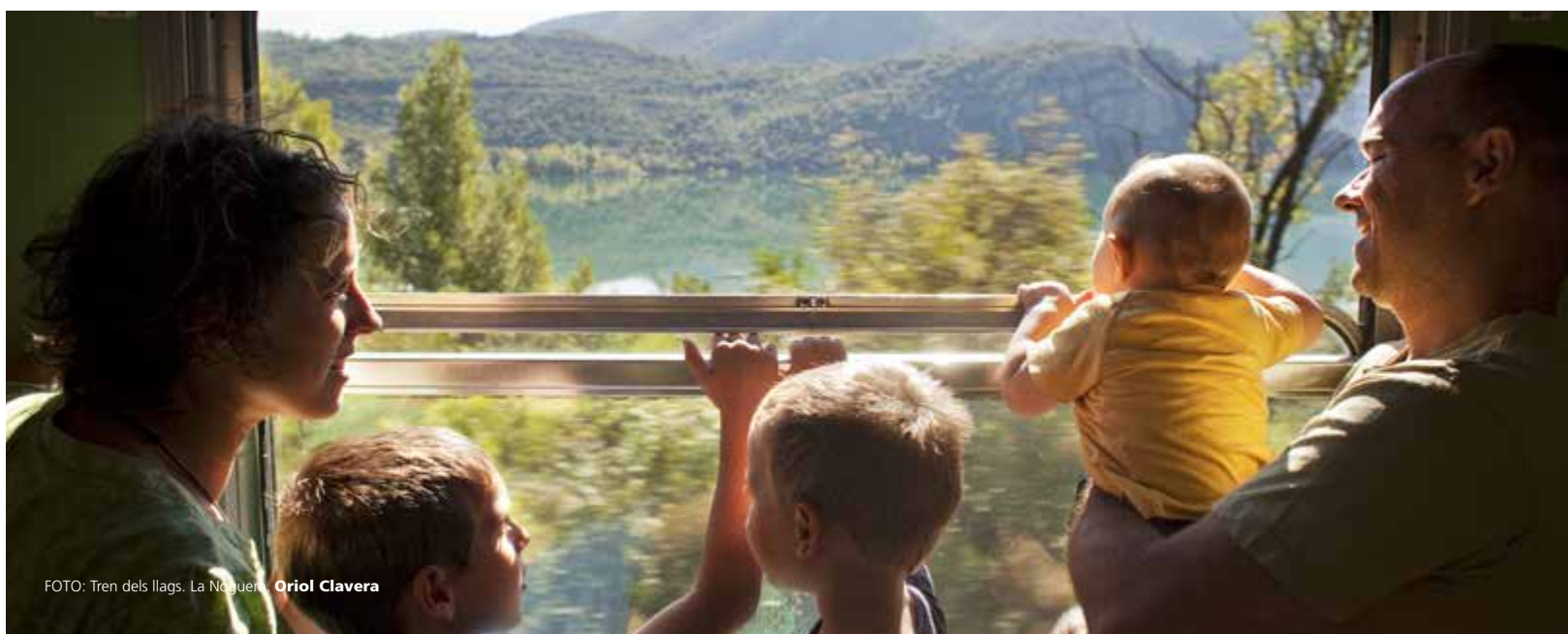
FOTO: Tren dels llacs. La Noguera.