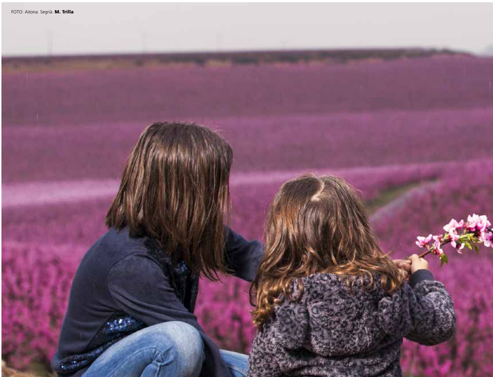
FOTO: Aitona. Segrià.

Y los diferentes reconocimientos a este espíritu sostenible que el Pirineo y las Tierras de Lleida ya han obtenido confirman la adecuada resolución del territorio en la adaptación a los cambios que la preservación del planeta nos pide. Por eso, Lleida ya ostenta estas distinciones: "Biosphere Destination" para toda