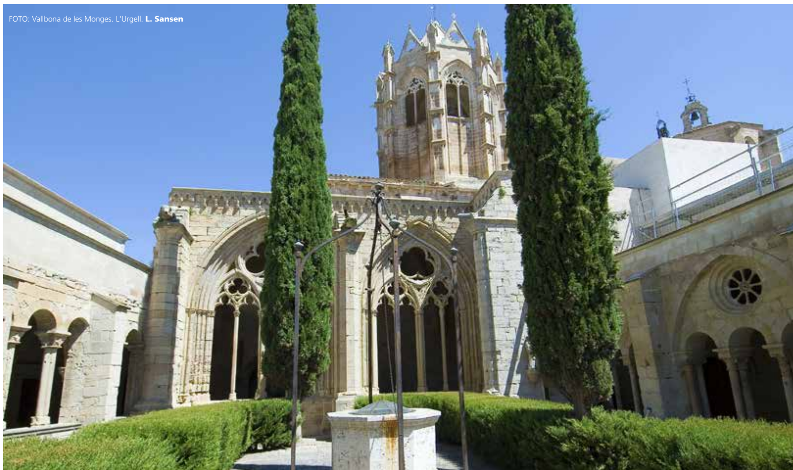
FOTO: Vallbona de les Monges. L'Urgell.

www.monestirvallbona.cat/historia-del-monestir/