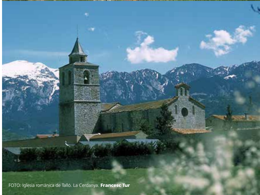
Iglesia romànica de Talló. La Cerdanya.