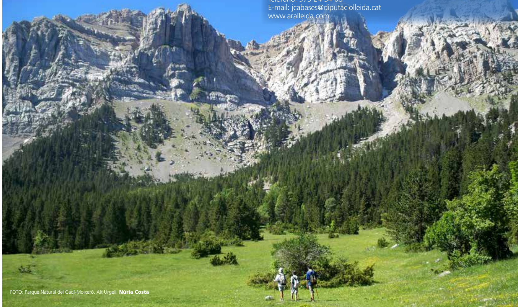
Parque Natural del Cadí-Moixeró. Alt Urgell.