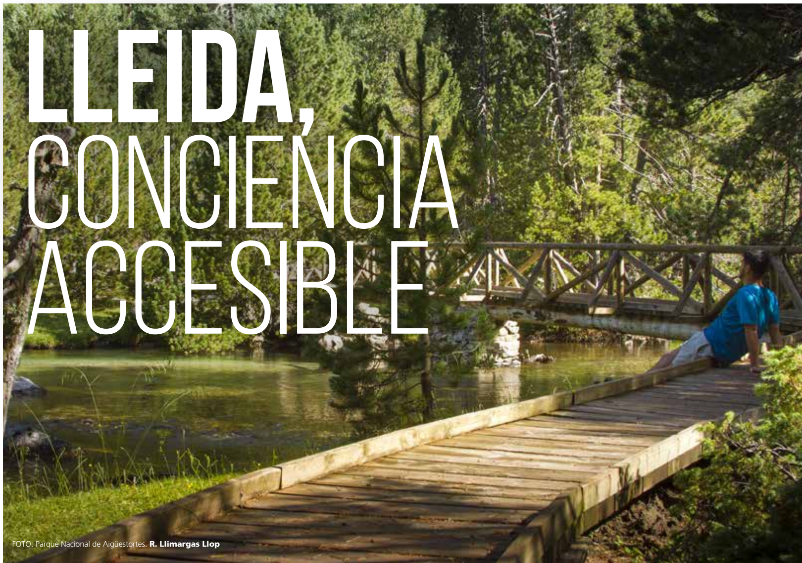
Parque Nacional de Aigüestortes.

Conciencia de inclusión para el goce de cualquier persona, al margen de sus condicionantes físicos o psíquicos, es un concepto que forma parte de la sostenibilidad que el progreso pide para el bien común.