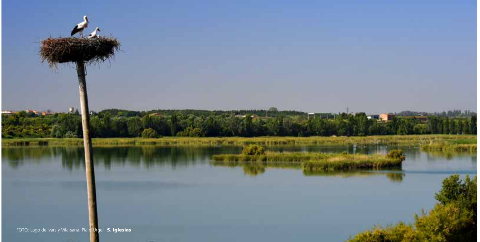
FOTO: Lago de Ivars y Vila-sana. Pla d'Urgell.