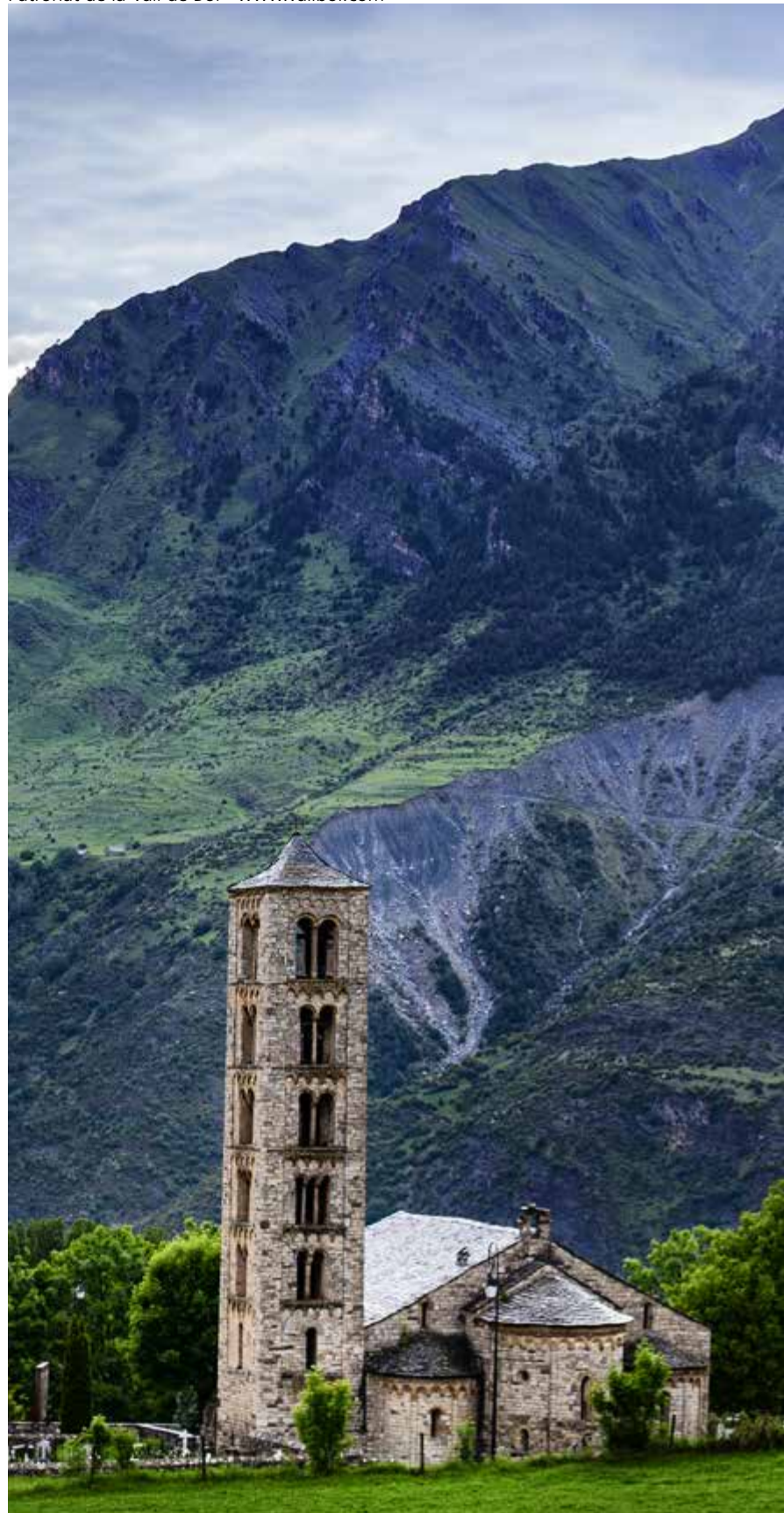
Sant Climent de Taüll. Alta Ribagorça.

Patronat Comarcal de Turisme de l'Alta Ribagorça - www.turismealtaribagorca.cat Patronat de la Vall de Boí - www.vallboi.com