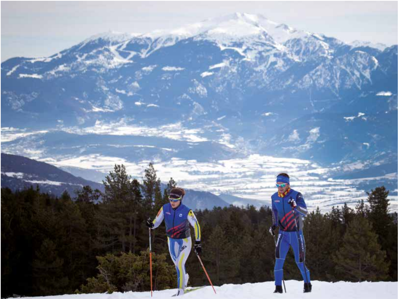
FOTO: Estación de esquí Aransa. La Cerdanya. Estación de esquí Aransa