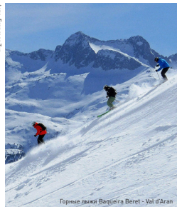
Горные лыжи Baqueira Beret - Val d'Aran

Провинция Лейда расположена на удивительной и богатой земле в западной Каталонии. Она граничит с провинциями Барселона, Жирона, Таррагона и Усика, а также с Францией и Андоррой на севере. Этот край с завораживающими контрастными пейзажами обречет восприятие. В любое время года здесь можно прекрасно отдохнуть, наслаждаясь природой, культурой, развлекательной программой и кухней. Кроме того, во всем мире Лейда славится своими горнолыжными курортами и другими возможностями для активного отдыха и занятий экстремальными видами спорта. Зима в Лейде — это море впечатлений. В Пиренеях на территории провинции нахо-