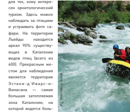
рафтинг Pella's Sobirà

для тех, кому интересен ориентологический туризм. Здесь можно наблюдать за птицами и устранивать фото сафари. На территории Лейды находится аэропорт Лейда, в котором находится 90% существующих в Каталонии видов птиц (всего их 400). Прекрасным местом для наблюдения является территория Эстанья-д'Иварс-и-Вальсана — самая большая затопляемая зона Каталонии, на которой водятся более 210 видов птиц. Помимо прекрасной природы, провинция Лейда обладает богатой культурным наследием. Посетители провинции могут познакомиться с ее величественным монументальным достоянием. Здесь остались памятники романского искусства, средние века наиболее известны девять церквей в долине Валь-де-Бок, окруженные необычайной природой и объявленные частью Всемирного наследия, есть и замки, такие как Монтегис и Мур, напоминающие о средневековом прошлом, необыкновенный, грандиозный собор, такие как Сед-Валь в городе Лейда, соборы городов Сед-де-Урхель и Солсона, а также прекрасный цистерцианский монастырь в городе Вальбона-де-лес-Моисес. Но для того, чтобы узнать страну со всех сторон, необходимо по-